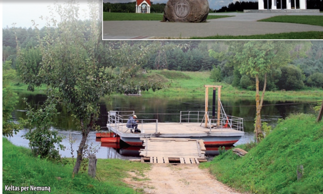
Keltas per Nemuną