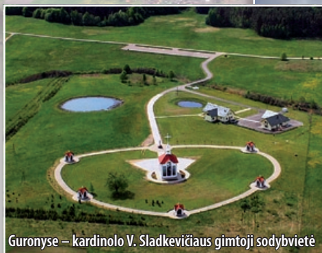
Guronyse – kardinolo V. Sladkevičiaus gimtoji sodybvietė